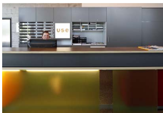
Farbakzente beim Interieur ergänzen den farblich neutralen Grundton des Gebäudes, das viele Ausblicke ins Grüne gewährt.

Seinen neuen Firmensitz fand das Unternehmen U|S|E AG, Systemintegrator für Photovoltaik, in einem wellenförmigen Gebäude, das Büro- und Lagerräume unter einem Dach vereint. Ein liches und begrüntes Atrium dient auch als Treppenhaus und indirekte Belichtung der Lagerräume. Insgesamt unterstützt die großzügige flexible Gebäudestruktur wachsende und wechselnde Prozesse. Gezielter Tageslichteinfall strukturiert den Raum, wobei eine „Grüne Mitte“ den Open Space von kleineren Büroeinheiten trennt. Da sich das Unternehmen, welches sich in einem Wachstumsmarkt befindet und unter anderem solare Großanlagen realisiert, schnell expandiert, sind die Bürolayouts im Großraum flexibel angelegt, so dass nachverdichtet oder schnell neu gestaltet werden kann. Mittelzonen unterstützen Gespräche und Interaktionen durch eine entsprechend einladende Möblierung.